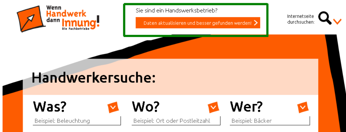
Abb. 4 Login-Button am oberen Bildrand der Webseite

Einträge ergänzen oder bearbeiten können Sie über einen Login-Bereich, den Sie über einen Button ganz oben auf der Webseite erreichen.