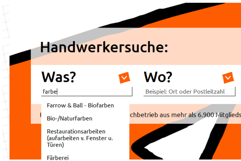
Abb. 2 Suchbegriffe werden vorgeschlagen

Bei Eingabe von Begriffen macht das System Vorschläge, welche Begriffe gesucht werden könnten. Das System findet sowohl Wortanfänge als auch Buchstabenkombinationen innerhalb eines Wortes. Die Suche startet bei Betätigung der Enter-Taste oder bei Auswahl eines Begriffs im Drop-Down-Menü, das bei Eingabe von Buchstaben erscheint.