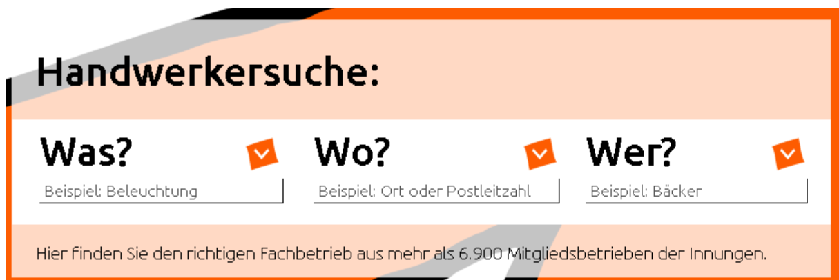
Abb. 1 Grundstruktur der Handwerkersuche

Die WHdl-Webseite bietet Verbrauchern unterschiedliche Möglichkeiten, einen geeigneten Handwerksbetrieb zu finden. Bei der Handwerkersuche muss nur eine der drei Fragen Wer, Wo, Was beantwortet werden und der Verbraucher bekommt eine Liste an Innungsbetrieben.